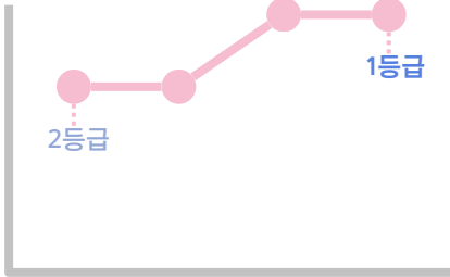
연세대 의대 합격 김00 학생